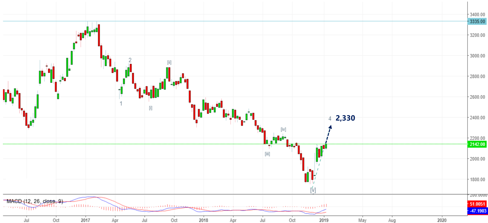
Palm Oil Futures, Malaysia, KualaLumpur:1FCPOc1, W

Pada chart weekly untuk komoditas CPO, kami memperkirakan bahwa harga CPO masih dapat menguat untuk membentuk wave 4 di level 2,330.