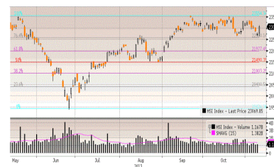
Hang Seng Index

Kejatuhan tidak terduga data Construction Spending -0,3% di bulan November dan kejatuhan data sektor Manufacturing Desember terendah selama 6 bulan terakhir menjadi faktor DJIA ditutup naik tipis di awal perdagangan awal tahun 2015 ditengah sepiunya perdagangan Jumat 02 Januari 2015 tercermin dalam volume perdagangan berjumlah 5,29 miliar saham. Walaupun Jumat naik tipis, selama 1 minggu DJIA ditutup turun -1,22%.