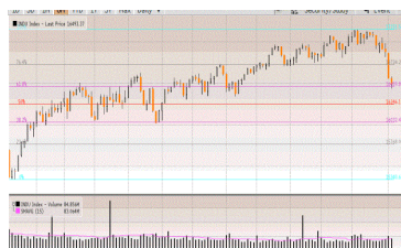
Dow Jones Index