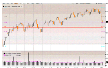
Dow Jones Index