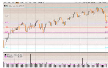
Dow Jones Index