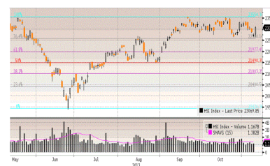
Hang Seng Index

Kombinasi mengecewakannya data China Industrial Output bulan November yang hanya tumbuh 7,2%, jauh di bawah forecast sebesar 7,8% dan di bawah data Oktober sebesar 7,7% walaupun data retail sales ekspansi 11,7% tetapi belum adanya tanda-tanda rebound nya Fixed Asset Investment padahal sebagai kunci utama bagi aktifitas ekonomi untuk bertumbuh serta tajamnya kejatuhan harga WTI crude oil yang pada gilirannya memicu aksi jual saham berbasis energy seperti Exxon dan Cevron turun masing-masing -7,7% dimana harga WTI sudah turun -46% sejak Juni 2012 menjadi faktor DJIA turun tajam -325,51 poin (-1,79%) ditengah ramainya perdagangan Jumat 12 Desember tercermin dalam volume perdagangan berjumlah 7,6 miliar saham (di atas rata-rata perdagangan dari awal Desember—12 Desember yang berjumlah 6,9 miliar saham). Dengan kejatuhan Jumat, selama 1 minggu DJIA turun -677,96 poin (-3,77%).