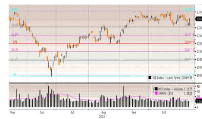
Hang Seng Index

Pernyataan Gubernur The Fed Charles Plosser yang mengatakan terdapat kemungkinan proses unwind Balance Sheet tidak akan berjalan mulus yang diartikan The Fed mungkin mempercepat penghentian program bond buying dibandingkan perkiraan sebelumnya menjadi faktor DJIA Jumat ditutup menguat tipis +28,64 poin (+0,17%) di level 16469,99 disertai kejatuhan The VIX -3,30% ditutup di level 13,76, sehingga selama 1 minggu DJIA turun tipis -8,47 poin (-0,05%).